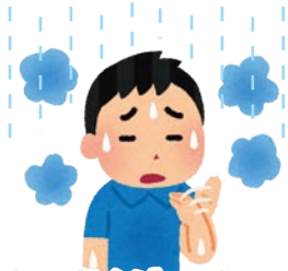
湿度が高くジメジメする