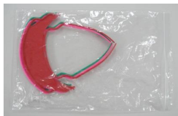
バイザー、ノーズピース