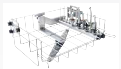
ハンドピース用ラック本体

※本カタログの表示価格は、メーカー希望小売価格で消費税は含んでおりません。 ※印刷の都合上、質感や色が実際の商品と異なる場合があります。 ※本カタログに掲載の仕様・形状・価格などは、改良などの理由により、予告なしに変更することがあります。