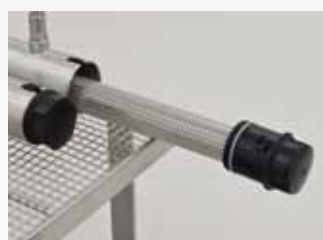
マイクロフィルター