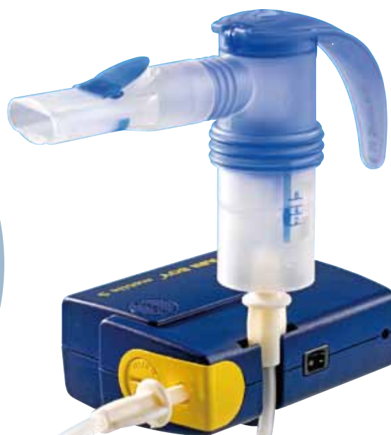
PARI ボーイモバイルS 標準価格 ¥24,000

リチウムイオン電池を使用しており、フル充電で約45分間(薬剤2.5mlの吸入が約8回分)の使用が可能です。