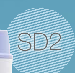
注文コード M80-000-02 標準価格