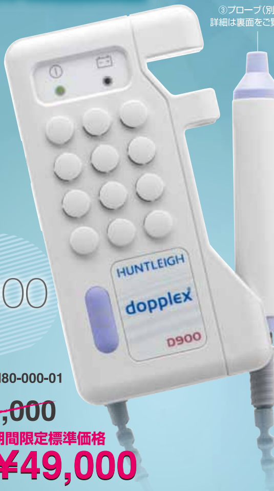
③プローブ(別売品) 詳細は裏面をご覧ください

画面上で血流方向及びその速度を 検知可能。より専門性の高い用途に 適した超音波血流計