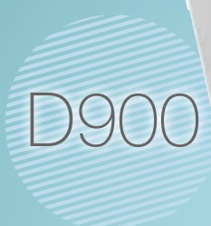
注文コード M80-000-01 標準価格