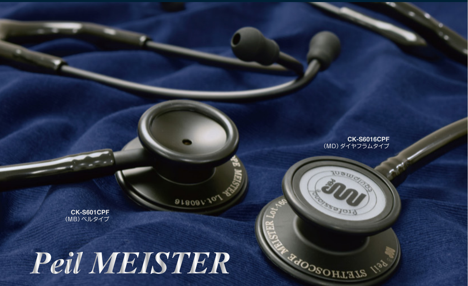
CK-S601CPF (MB) ベルタイプ