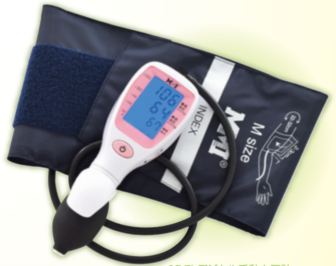
MMI® デジタル手動血圧計 コンフォール