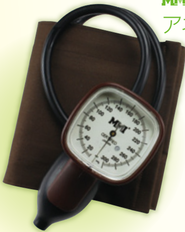
MMI® ワンハンド式 アナロイド血圧計