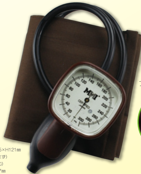
プッシュレバーバルブ