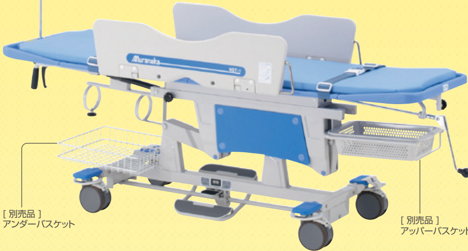
[別売品] アンダーバスケット