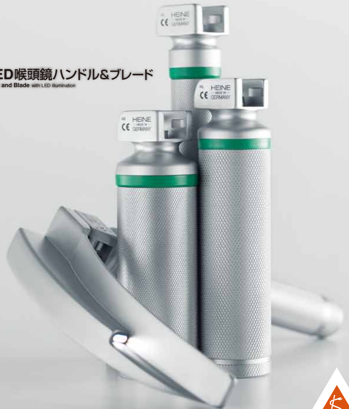
HEINE LED喉頭鏡ハンドル&ブレード Laryngoscope Handle and Blade with LED illumination

ハイネ喉頭鏡は、すべてISO7376-3/EN1819(グリーンスタンダード)に適合しています