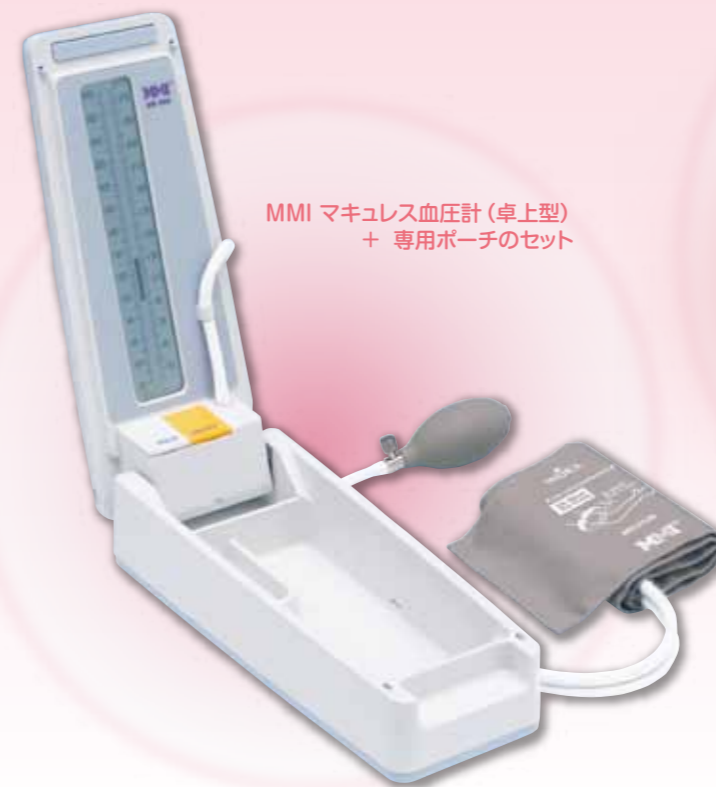
MMI マキュレス血圧計 (卓上型) + 専用ポーチのセット

〒540-0036 大阪市中央区船越町 2-3-6 ☎06-6943-1221(代) FAX06-6947-5360 総合センター 〒594-1157 大阪府和泉市あゆみ野 2-8-2 ☎0725-53-5541(代) FAX0725-53-5641 東京支店 ☎03-3813-9211(代) FAX03-3813-9217 札幌営業所 ☎011-737-9121(代) FAX011-737-9122 仙台営業所 ☎022-274-7780(代) FAX022-271-8448 埼玉営業所 ☎048-844-3500(代) FAX048-844-3501 金沢営業所 ☎076-286-4531(代) FAX076-286-0490 名古屋営業所 ☎052-709-7111(代) FAX052-709-7116 村中船越ビル ☎06-6943-1159(代) FAX06-6946-0184 米子営業所 ☎0859-33-6231(代) FAX0859-33-7930 広島営業所 ☎082-532-1800(代) FAX082-233-8818 福岡営業所 ☎092-473-0123(代) FAX092-474-1363