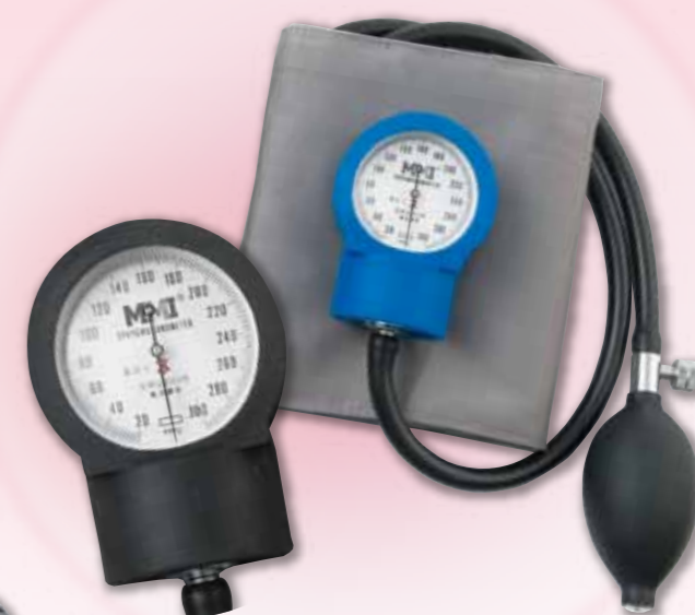
MMI アネロイド血圧計 (耐衝撃型)