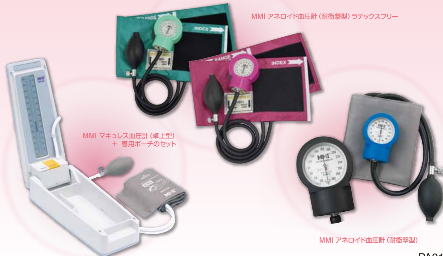
MMJ マキユレス血圧計 (卓上型) + 専用ポーチのセット