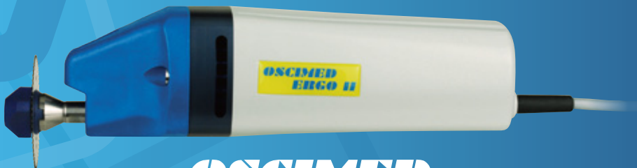
OSCIMED ERGO II