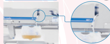
スリット構造、左右にフック各3カ所