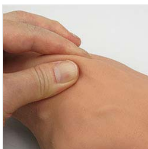
本物のような柔らかい皮膚