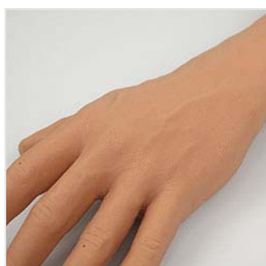
外観もリアルに再現