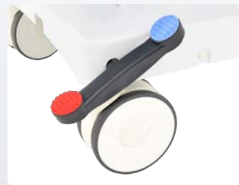
大型双輪キャスター(φ150mm) フットペダルひとつで4輪すべてを同時にロック。