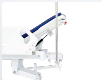
イルリガートル棒 ガートル受けは頭側・足側に各2カ所。