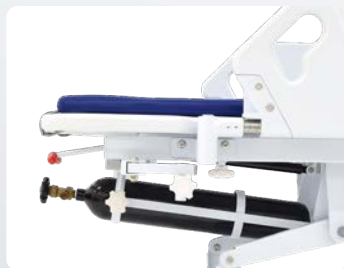
酸素ボンベホルダー 酸素ボンベホルダーを標準装備。