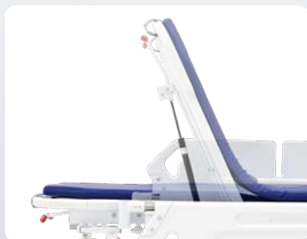
背上げ機能(無段階) スムーズな操作で患者の体位調整が可能。